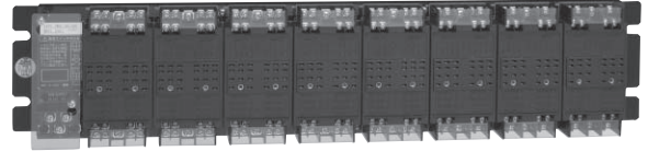
FWBA-16DY-B00 479×99×62mm/1.6kg (質量・寸法表示はトランスデューサ等を含んでいません)