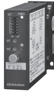
FSZL-□□×□×□□0 (29.5×76×125mm) 180g