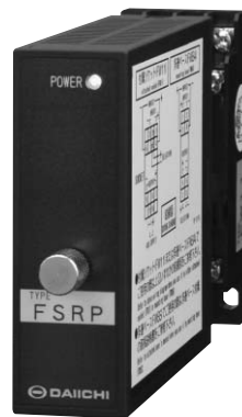
FSRP-00□□X□□0 (29.5×76×125mm) / 180g